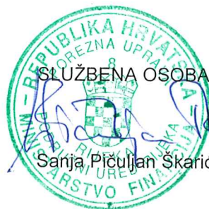
Sanja Piculjan Skarić